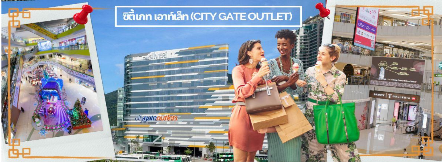
ซิตี้เกต เอาท์เล็ต (CITY GATE OUTLET)

🕒 อิสระอาหารเที่ยงและเย็นตามอัธยาศัย **ไม่รวมอยู่ในโปรแกรม** เพื่อความสะดวกในการช้อปปิ้ง ได้เวลาอันสมควร รถรับท่านกลับเข้าที่พัก