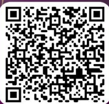
ไอส์เท็กทั้งหมด