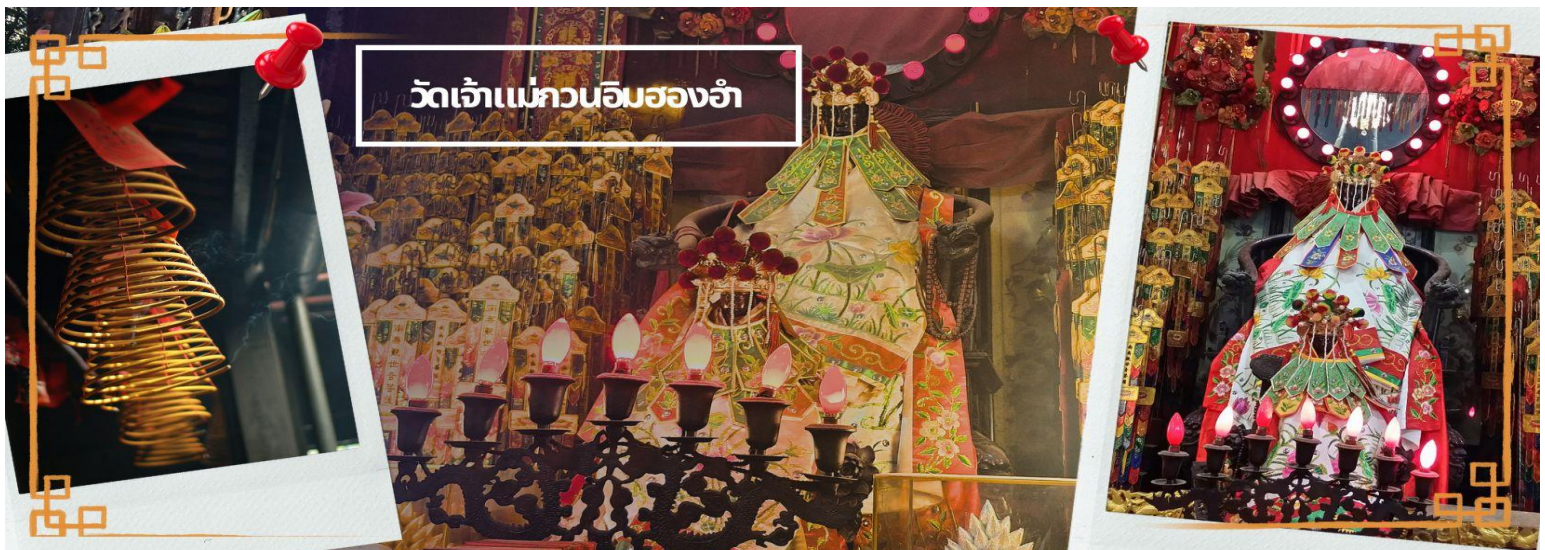
วัดเจ้าแม่กวนอิมสองอ้า

เช้า 🕒 บริการอาหารเช้า ณ ภัตตาคาร **เมนูเต็มชุดสำหรับฮ่องกง** (4)