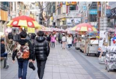
อาหารท้องถิ่นต่างๆอีกเพียบ

นำทุกท่านเดินทางสู่ ตลาดตลาดวอลกิ้งสตรีทนามโพดง (Nampodong) แหล่งช้อปปิ้งเมืองปูซาน แหล่งช้อปปิ้งอันดับต้นๆ ที่ขาช้อปปิ้งทั้งหลายรู้จักกันเป็นอย่างดี เพราะย่านนี้ถือเป็นศูนย์รวมแฟชั่นชั้นนำของหนุ่มสาวปูซาน และนักท่องเที่ยวเลยก็ว่าได้ หากอยากดูเทรนด์การแต่งตัวเหล่าสาวหน้าแดง หรือจะมองหนุ่มหน้าใส มาที่นี่รับรองว่าไม่ผิดหวังแน่ๆ ถ้าจะให้เปรียบก็คล้ายๆกับย่านสยามของบ้านเรานั่นเอง รวมถึงอาหารฟูดสตรีท