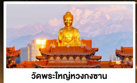
วัดพระใหญ่หวงกงชาน