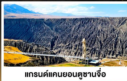
แกรนด์แคนยอนตูชานจื่อ