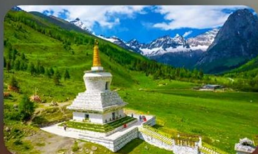
กุเวาสีดรุณี