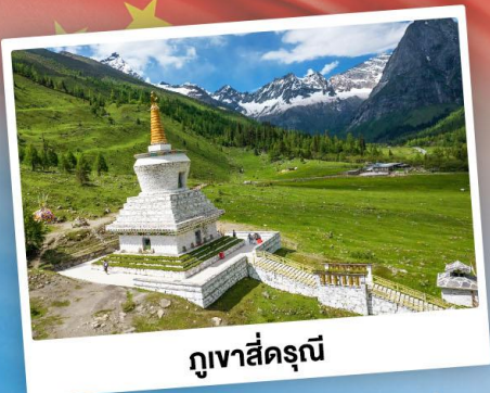
กู๋เจาสื่อตรุณี