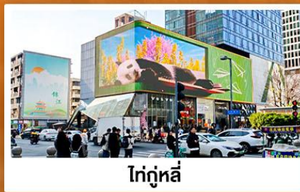
ไท่กู๋หลี่