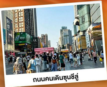
ถนนคนเดินชุนชี่อู่