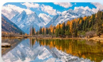
สี่ครุณี