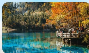
จิ้งจ้ายโกว