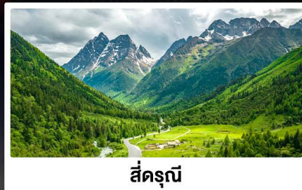
สี่ดรุณี