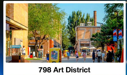
798 Art District