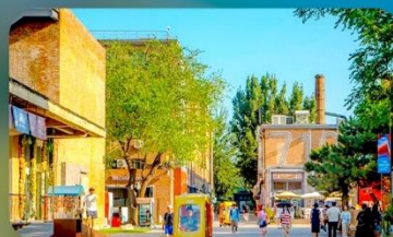
798 Art District