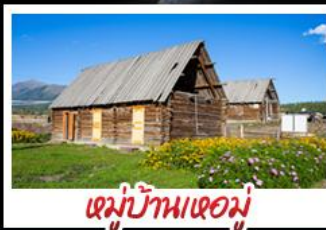
หมู่บ้านเหม่อ