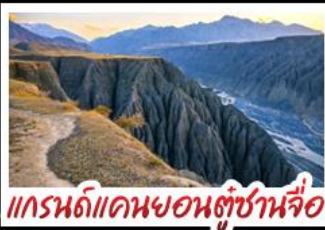
แกรนด์แคนยอนตุ่ซำจื่อ