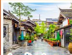
ชอยกว้างชอยแค