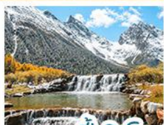
อุทยานน้ำเปิงทิว