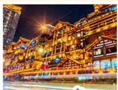
เจดีย์หยาดัง

อุทยานหลุมฟ้าสะพานสวรรค์ • อุทยานเขาแดงฟ้า • หงหยาดัง • ดึกซุยซิง ชั้น 22 • วัดคำฉื่อ ชมรถไฟกะสุติก • สะพานโบราณหนานเฉียว • เมืองโบราณกวนเซี่ยน • อุทยานภูเขาสีดรุณี อุทยานตำกูปิงชาน • จตุรัสหยางเทียนหู่ • รูปปั้นหมี่แพนตันอมซลฟี • ร้านหนังสือจุกเทอ ถนนคนเดินซุนซีลู่ • หมี่แพนคำป็นตัก IFS • ถนนไม้กุ๋หลี่ • ถนนโบราณชอยกว้างชอยแค