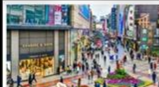
ซ้อมปักกิ่งถนนชุนซีวู่