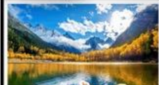
อุทยานป่าแดงโกว