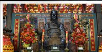
วัดบิกิตฮองฮำ