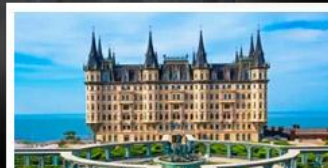
ไรไวน์และคฤหาสน์จางยู