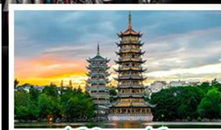
เจดีย์จินเจดีย์ทอง