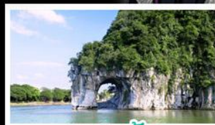
ฝางวงช้าง