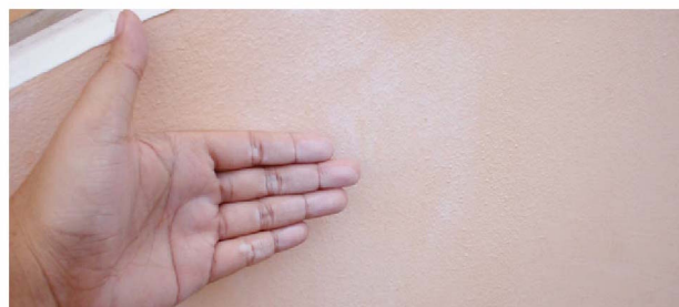
▲ สีเสื่อมสภาพเป็นฝุ่นผง (Chalking)