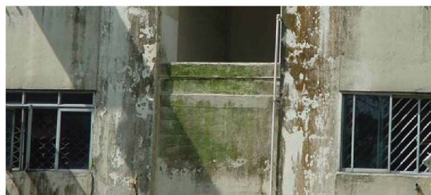
▲ เชื้อราและตะไคร่น้ำ (Fungi and Algae)