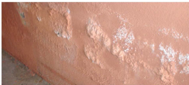
▲ คราบเกลือหรือคราบขาวบนฟิล์มสี (Efflorescence)