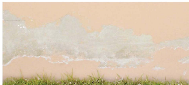
▲ ฟิล์มสีลอกหลุด (Peeling)