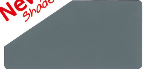
Gray / เทา