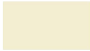
Melt Butter W9019