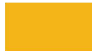
Lemon Yellow AQ434