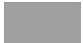
Scream Gray K7063