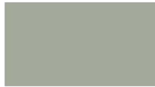
Diving Green N6316