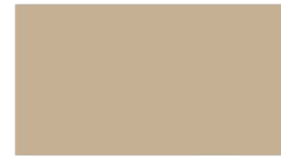
Warmth Godiva O1046