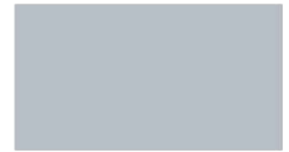
Silver Bronze AQ1000