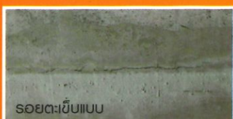
รอยตะขี้บ่แบบ