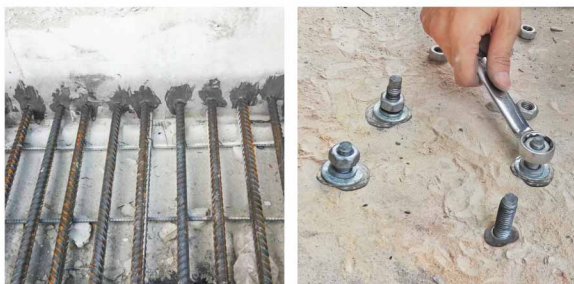
งานเสียบเหล็ก