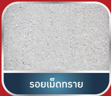
รอยเม็ดทราย

เป็นปูนฉาบบางสำเร็จรูป สามารถฉาบบางได้ 0.3 - 2 มม. ใช้สำหรับฉาบแต่งผิวคอนกรีตรอยตะเข็บจากการถอดแบบของคอนกรีต สามารถใช้ปิดรอยแยก รอยแตกลายงา รูดรูพรุนตามด รูโพรงอากาศ ทำให้พื้นผิวหลังจากฉาบแล้วดูเรียบเนียนขึ้น