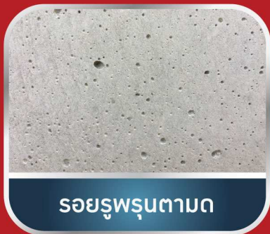
รอยรูพรุนตามด