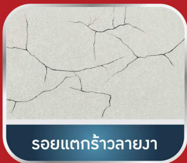
รอยแตกร้าวลายงา