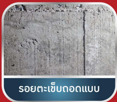
รอยตะเข็บถอดแบบ