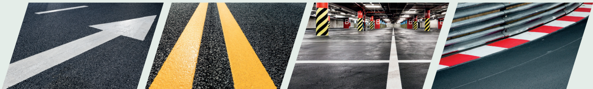
ลูกศรบอกทาง