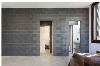
ผนังก่ออิฐมวลเบา