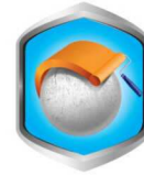
กลบมิดดีเยี่ยม

หมายเหตุ: มีการทดสอบบนพื้นผิว 2 สภาวะด้วยกัน คือ บนพื้นผิวใหม่ และพื้นผิวที่เป็นฝุ่นชอล์ค