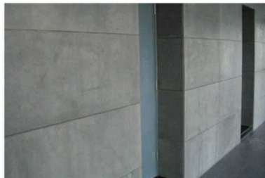
แผ่นไฟเบอร์ซีเมนต์