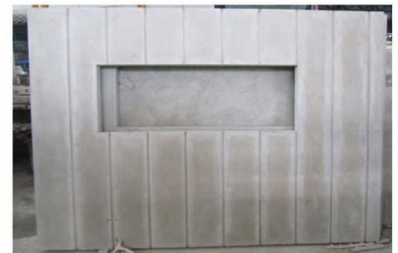
แผ่น Precast (แผ่นคอนกรีตหล่อสำเร็จ)