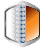
ยึดเกาะดีเยี่ยม