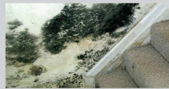
เชื้อราและตะไคร่น้ำ (Fungi and Algae)