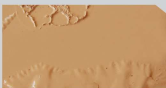
สีโป่งพอง (Blistering)