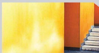
สีซีดจาง (Fading)