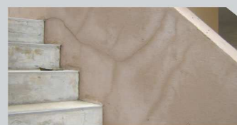
สีเป็นคราบเกลือ (Efflorescence)