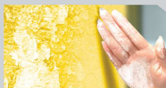
สีเป็นฝุ่นซอลค์ (Chalking)