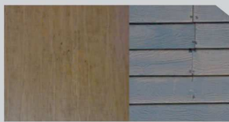
สีไม่เกาะพื้นผิว (Poor Adhesion)