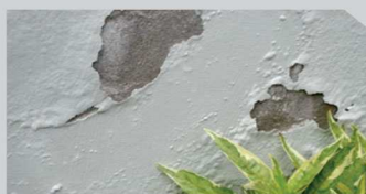
สีลอก่อน (Peeling)