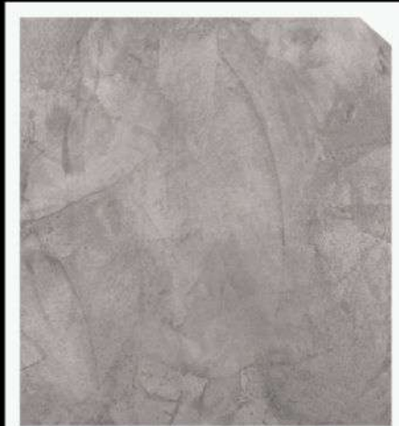
สีเทาอ่อน / Light Grey #AAF-0102