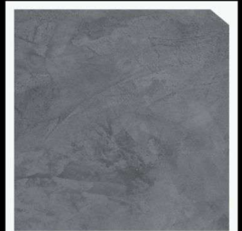
สีเทาเข้ม / Dark Grey #AAF-0103