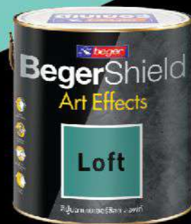
สูตรน้ำมัน