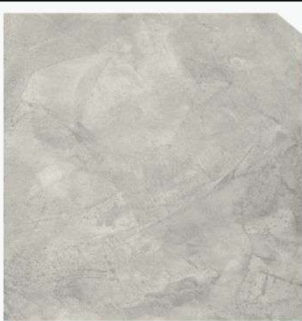
สีธรรมชาติ / Natural Grey #AAF-0101

สีปูนฉาบเบเจอร์ชิลด์ อาร์ค เอฟเฟกซ์ อควาลอฟท์ สีตกแต่งภายในและภายนอก แบบใช้งานได้ทันที ผลิตภัณฑ์อะคริลิกโพลีเมอร์แท้ 100% ด้วยสูตรพิเศษที่ให้การยึดเกาะดีเยี่ยม เนื้อฟิล์มสีมีความแข็งแรงและยืดหยุ่น ปกปิดรอยแตกขยายมาบนผนัง ทนทานต่อสภาพต่าง ความชื้นของผิว และสภาวะอากาศได้เป็นอย่างดี อีกทั้งยังมีส่วนผสมของหินภูเขาไฟ (VOLCANIC ROCK) ที่ช่วยในการดูดซับโมเลกุลก๊าซของกลิ่นไม่พึงประสงค์ ช่วยให้อากาศสะอาดบริสุทธิ์ สามารถออกแบบปูน, เหล็ก, ไม้ ฉาบลื่น ชัดง่าย ไร้กลิ่นฉุน และสามารถฉาบทับได้หลายชั้น โดยไม่เกิดปัญหาแตกล่อน ปรากฏคราบน้ำมัน สารปรอทและสารตะกั่ว