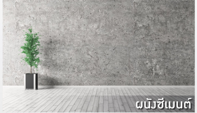
ผนังซีเมนต์