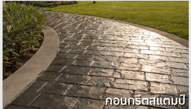
คอนกรีตสแตมป์

*ห้ามใช้กับกระเบื้องเซรามิก และแกรนิตโต้