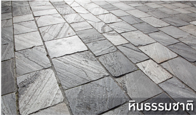
หินธรรมชาติ