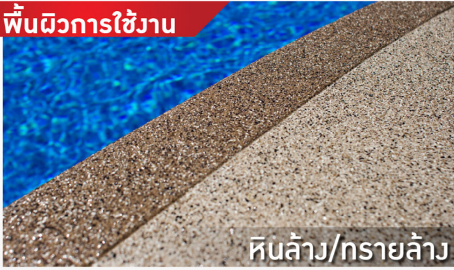
หินล้าง/ทรายล้าง