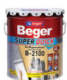
สีรองพื้นปูนออกประสมก กันชื้นสูง เบเยอร์ ซูเปอร์ควิก ไพรมอร์ บี-2100