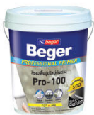
สีรองพื้นปูนใหม่กับปูนเก่า เบเยอร์ โปรเฟสชั่นแนล ไพรมอร์ บี-100

For perfect protection system ระบบสีครบวงจรเพื่อการปกป้องบ้านสมบูรณ์แบบ