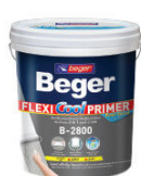
สีรองพื้นปูนออกประสมก เบเยอร์ เฟลิกซ์คูล ไพรมอร์ บี-2800