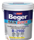
สีรองพื้นปูนกันชื้นออกประสมก (สูตรน้ำ) เบเยอร์ เรนควิก ไพรมอร์ บี-2900