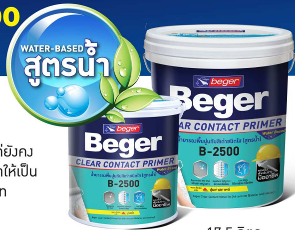
3.5 ลิตร 17.5 ลิตร

น้ำยารองพื้นปูนกับสีเก่าชนิดใส สูตรน้ำ กลิ่นอ่อน ผลิตจากกาวอะคริลิกแท้ 100% เหมาะสำหรับพื้นผนังปูนฉาบ ผนังคอนกรีต กระเบื้องแผ่นเรียบ ที่เคยทาสีมาแล้วแต่ยังคงสภาพดี เนื้อสีสามารถแทรกซึมผ่านช่วยเสริมการยึดเกาะพื้นผิวปูนเก่าและสีทับหน้าให้เป็นเนื้อเดียว ทนทานต่อน้ำ ต่าง ป้องกันการเกิดเชื้อราและตะไคร่น้ำ ปราศจากสารปรอทและตะกั่ว จึงปลอดภัยต่อผู้ใช้และผู้อยู่อาศัย สามารถใช้ได้ทั้งภายในและภายนอก