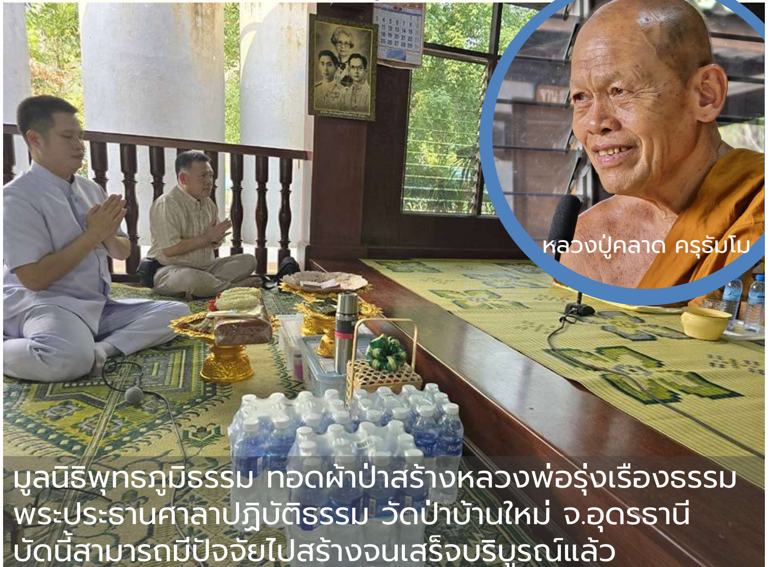
หลวงปู่ฉลาด ครุฑโม

มูลนิธิพุทธภูมิธรรม ทอดผ้าป่าสร้างหลวงพ่อรุ่งเรืองธรรม พระประธานศาลาปฏิบัติธรรม วัดป่าบ้านใหม่ จ.อุดรธานี บัดนี้สามารถมีปัจจัยไปสร้างจนเสร็จบริบูรณ์แล้ว