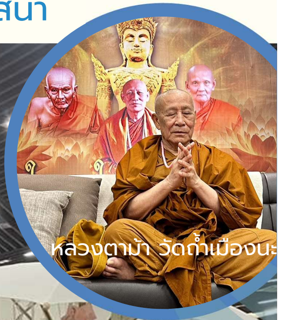
หลวงตาม้า วัดท่าเมืองนระ