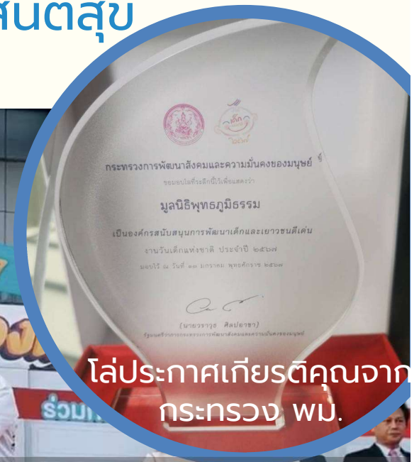
โล่ประกาศเกียรติคุณจาก กระทรวง พ.ม.

มูลนิธิพุทธรภูมิธรรมรับโล่ประกาศเกียรติคุณจาก กระทรวงการพัฒนาสังคมและความมั่นคงของมนุษย์ ( พ.ม. ) ในฐานะเป็นองค์กรสนับสนุนการพัฒนาเด็กและเยาวชนดีเด่น โดย รัฐมนตรีว่าการกระทรวงการพัฒนาสังคมและความมั่นคงของมนุษย์ ( รมว.พ.ม. ) เป็นผู้มอบโล่ ซึ่งการช่วยเหลือเด็กและเยาวชน โดยเฉพาะการส่งเสริมให้มีคุณธรรมนำความรู้ เป็นหนึ่งในนโยบายของมูลนิธิพุทธรภูมิธรรม ที่ได้ดำเนินงานมาอย่างต่อเนื่อง