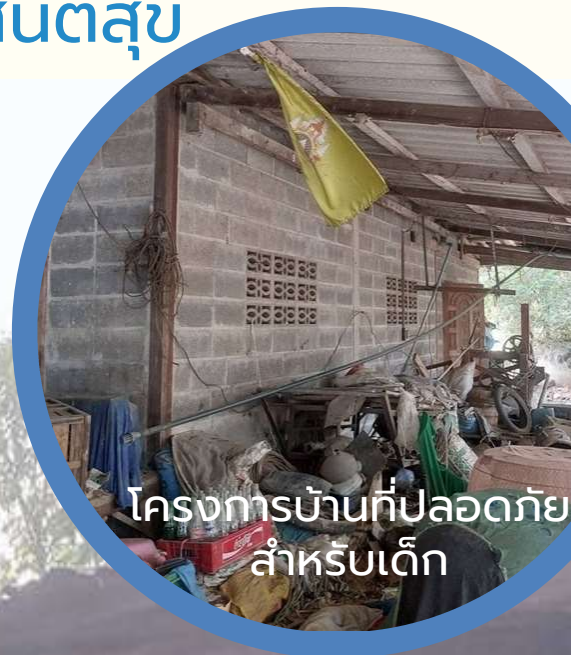
โครงการบ้านที่ปลอดภัย สำหรับเด็ก