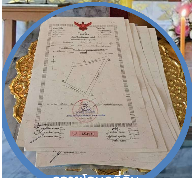
ถ่ายโฉนดที่ดิน

มูลนิธิพุทธภูมิธรรม ร่วมบริจาคค่ารังวัดออกโฉนดที่ดิน 325 ไร่ วัดสันติสังฆาราม จังหวัดสกลนคร เพื่อสร้างวัด และโรงพยาบาล