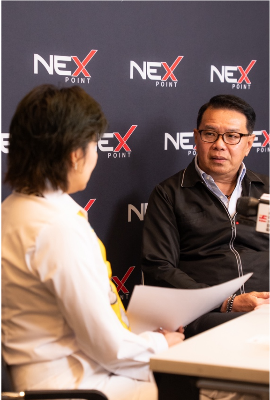
3月31日，集团董事长郭蕊女士对 NEX POINT 联席首席执行官 Thanapatch Sukasuthamwong 先生进行封面人物专访。本次专访不仅是对企业领袖的深度访问，更是对泰国 EV 科技与商业发展趋势的全方位解读。