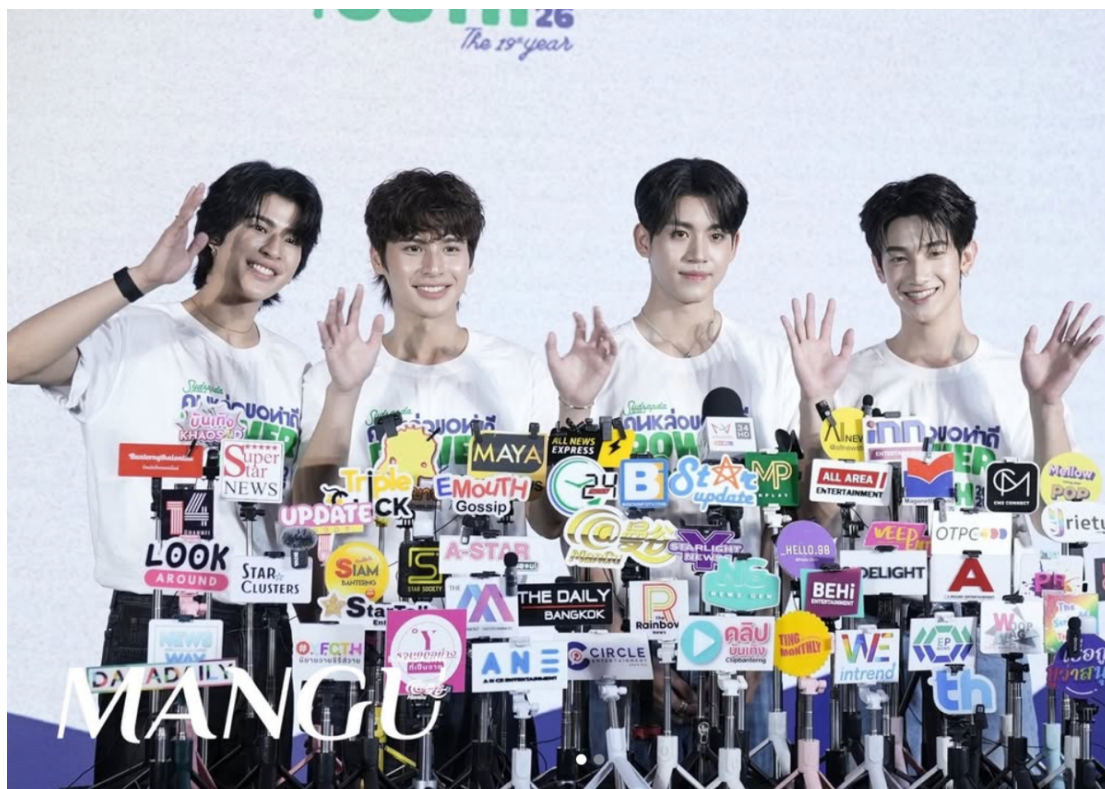
3月17日，曼谷杂志出席第十九届“Power of Youth”帅哥周末慈善活动。此次年度项目回归，汇聚了一批代表新一代力量的炙手可热的年轻艺术家和演员