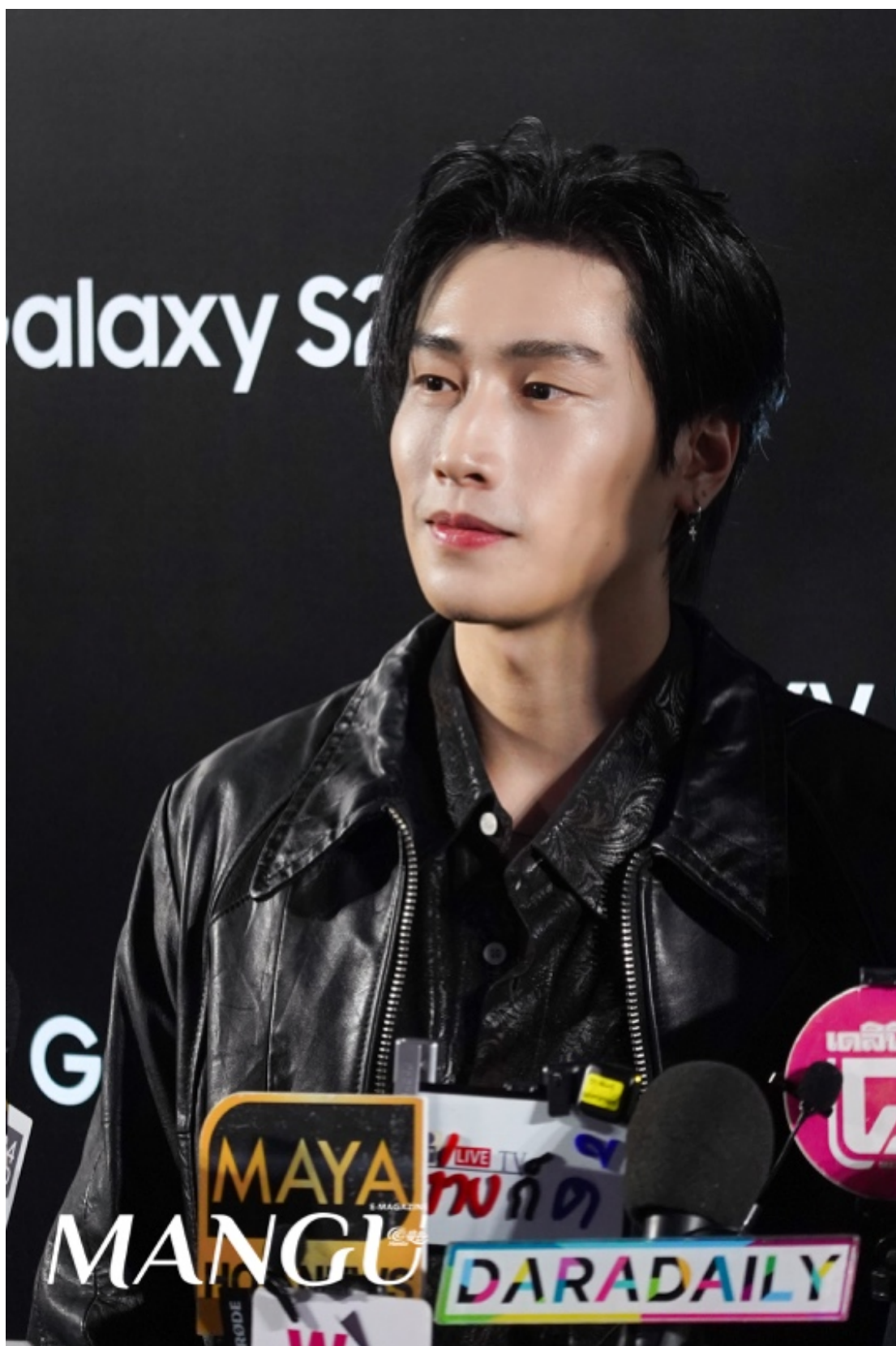
曼谷杂志出席三星发布会，活动现场被装点成一个“Galaxy Ultimate”体验空间，将尖端科技与无限乐趣完美融合。众多泰国艺人、明星和贵宾齐聚一堂