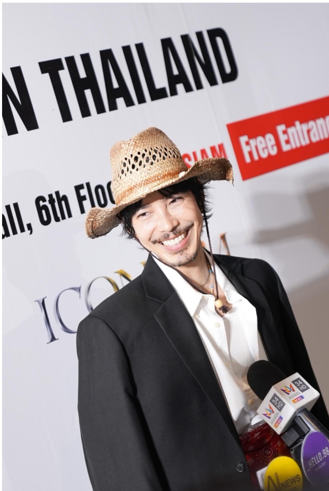
3月12号，曼谷杂志出席 ONE PIECE 主题快闪咖啡+沉浸式展览活动。现场人气火爆，粉丝与游客纷纷参与互动，充分展现了热门动漫 IP 在泰国市场的强大号召力，也进一步丰富了曼谷本地文娱消费场景。