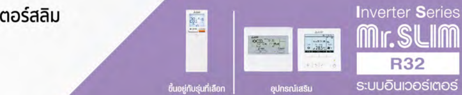
ขึ้นอยู่กับรุ่นที่เลือก

ปรับแรงดันปั๊มน้ำทิ้งให้มีประสิทธิภาพเพิ่มขึ้น จากระยะความสูง 400 มม. เป็น 600 มม. ให้ความยืดหยุ่นในการจัดวางท่อ และตำแหน่งในการติดตั้งเครื่อง