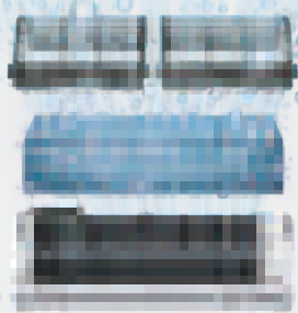
ล้างคอยล์เย็น

ระบบทำความสะอาดตัวเอง ล้างและเป่าแห้งคอยล์เย็น เพียงกดปุ่ม MOLD ค้างไว้ 2 วินาที ระบบจะช่วยทำความสะอาดภายในคอยล์เย็น ด้วยการควบคุมความชื้นให้กลายเป็นหยดน้ำชำระล้างสิ่งสกปรกที่สะสมอยู่ภายในเครื่องและเป่าแห้งด้วยลมเพื่อไล่ความชื้น ให้ออยล์เย็นสะอาดลดการสะสมของสิ่งสกปรกและกลิ่นอับ