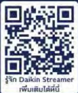
รู้จัก Daikin Streamer เพิ่มเติมได้ที่

ฟอกอากาศสะอาด ช่วยยับยั้งภูมิแพ้ และเชื้อโรค ปลอดภัย ดูแลทุกลมหายใจของคุณ และครอบครัว