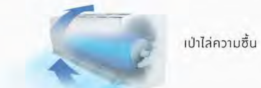
เป่าไล่ความชื้น