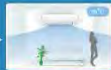
เมื่อมีการเคลื่อนไหวอีกครั้ง ตาอัจฉริยะจะปรับอุณหภูมิกลับสู่อุณหภูมิที่ตั้งไว้ตอนแรก