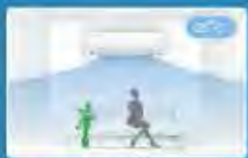
ห้ามปิดตามอุณหภูมิที่ตั้งไว้