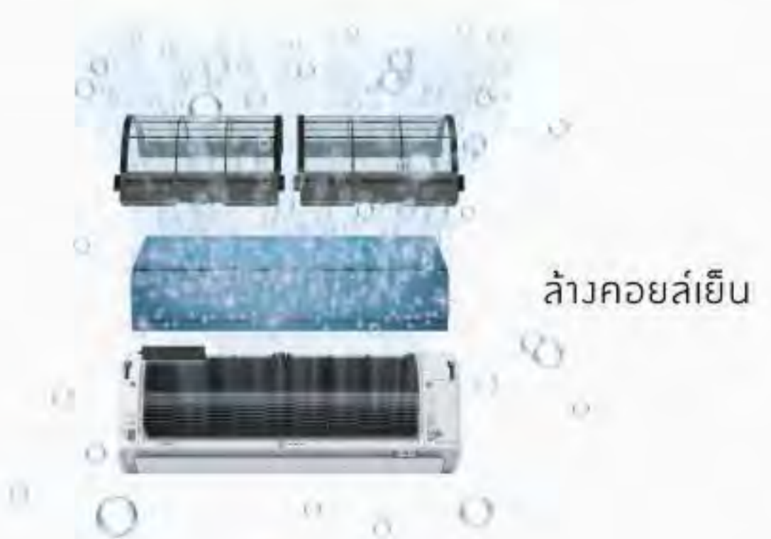
ล้างคอยล์เย็น