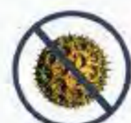
สารก่อภูมิแพ้