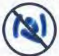
แบคทีเรีย