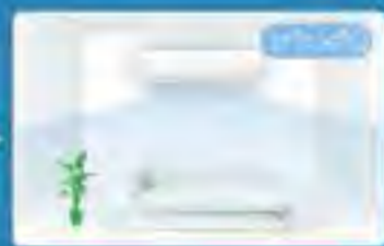
เมื่อไม่มีการเคลื่อนไหว 20 นาที