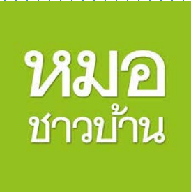
ความรู้ทั่วไป (10%)