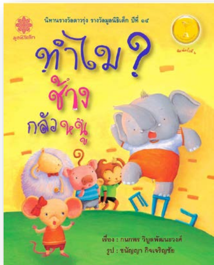
นิทานสำหรับเด็ก อายุ ๓-๕ ปี