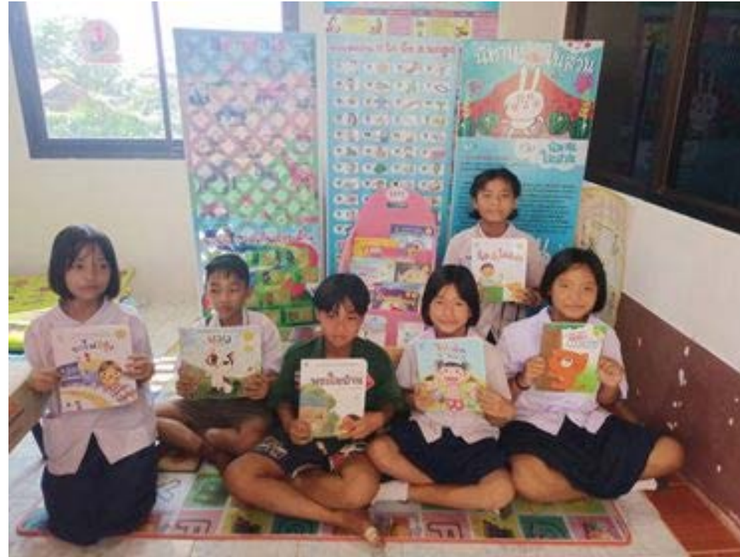
ภาพจาก รพ.สต.โนนเค็ง จังหวัดบึงกาฬ ได้รับเติมหนังสือ