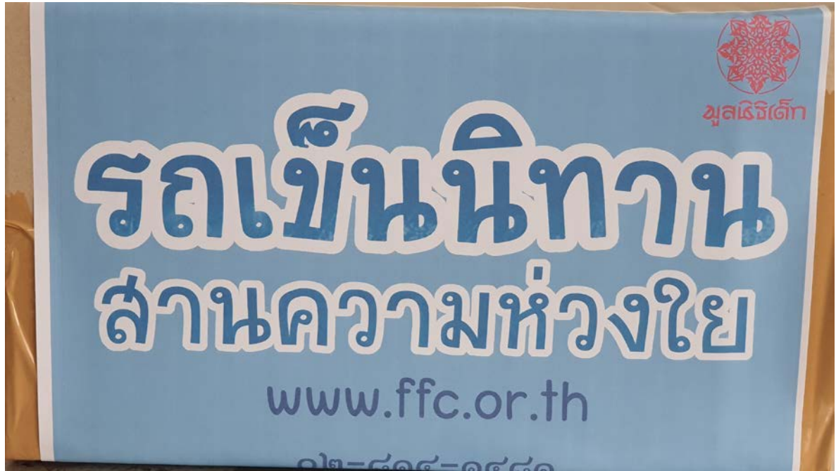
ชุดหนังสือ(เต็ม) 50 เล่ม มูลค่า 5,000 บาท ต่อ 1 แห่ง ประกอบด้วย