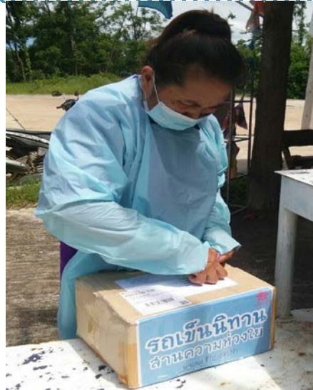
ศูนย์พักคอยรพ.สต.บ้านหนองยาง จ.พิจิตร