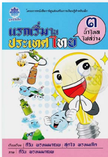
การ์ตูนความรู้