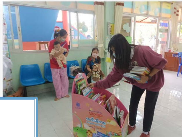
ภาพที่ 4 หมายเลข1854 รพ.สต.ผาจับ จังหวัดแพร่