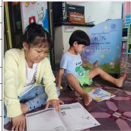
ภาพที่ 2 มุมพัฒนาการ รพ.สต.บ้านพงพรต จ.ศรีสะเกษ หมายเลขรถ 1833 ผู้บริจาค บริษัท มารุ่งโรจน์ จำกัด