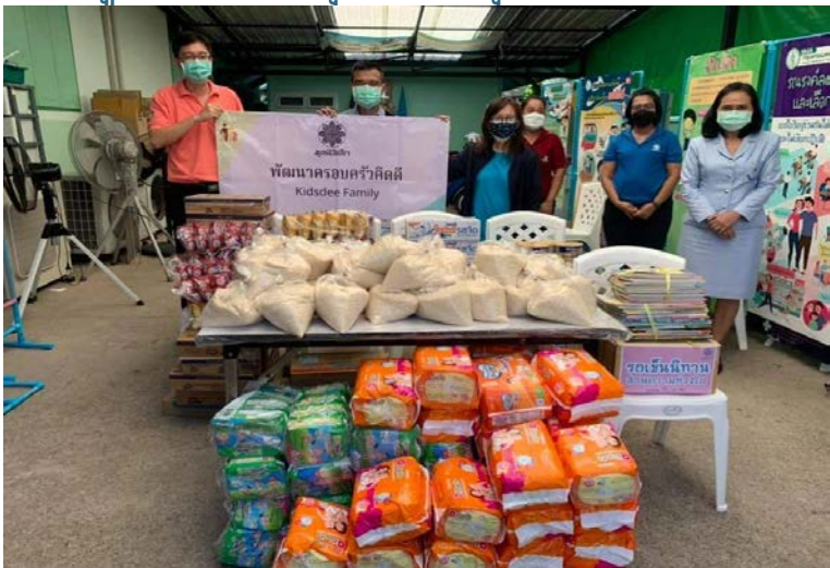
ศูนย์สาธารณสุข ๔๗ กรุงเทพฯ