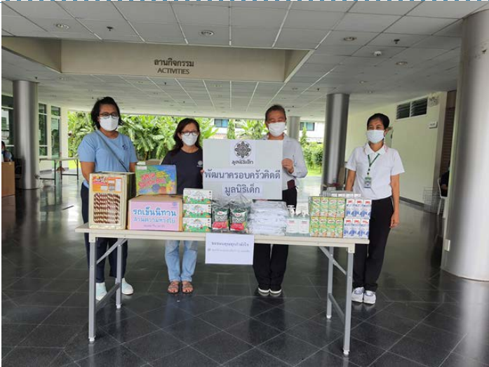
ศูนย์เกียกกาย กรุงเทพฯ