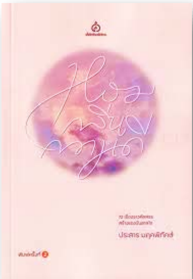
วรรณกรรม และความรู้ทั่วไป