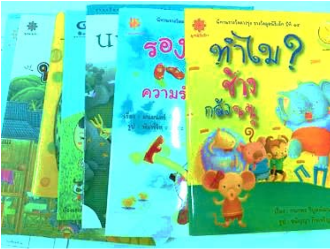
หนังสือนิทาน ตั้งแต่ ๓-๕ ปี (50%)

รถเข็นพร้อมหนังสือนิทาน มูลค่า 12,500 บาท • รถเข็น 1 คัน พร้อมพิมพ์ชื่อผู้บริจาค • หนังสือ 100 เล่ม มูลค่ารวม 10,000 บาท