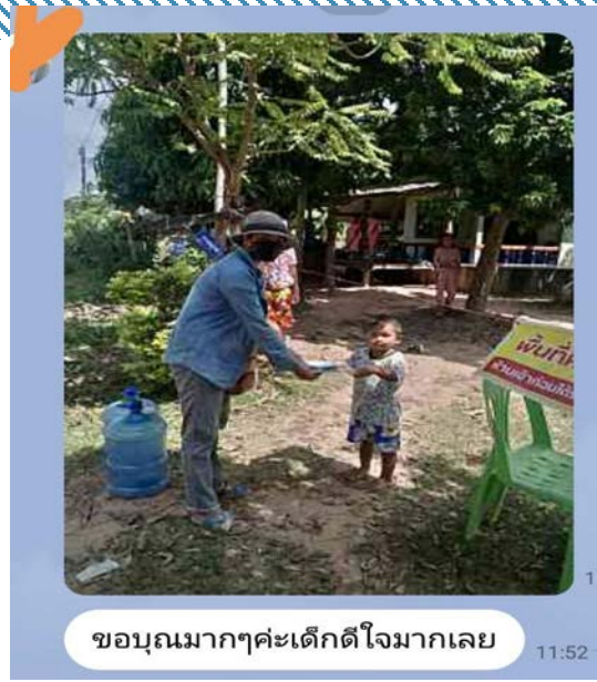
ผู้ป่วยสีเขียว รพ.สต.ทัพทัน จ.สุรินทร์