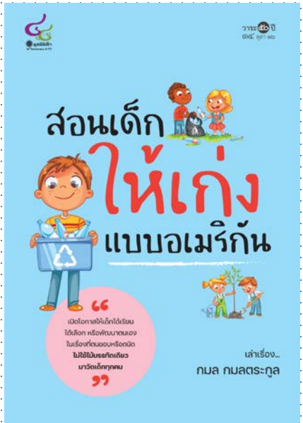
คู่มือเลี้ยงลูก (10%)