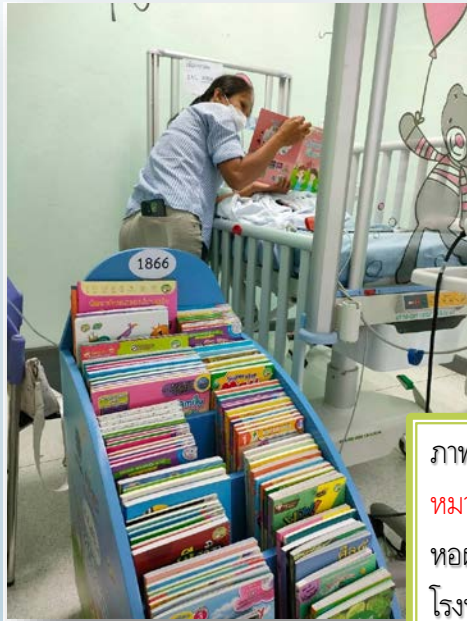
ภาพที่ 3 หมายเลข 1866 หอผู้ป่วยเด็ก โรงพยาบาลนพรัตน์ราชธานี จังหวัด.กรุงเทพฯ