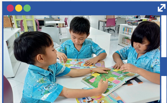
ตัวอย่าง

โรงเรียน ในภาคเหนือตอนบน จำนวน ๑,๐๐๐ โรงเรียน ในพื้นที่จังหวัดแม่ฮ่องสอน เชียงใหม่ ลำพูน ลำปาง เชียงราย น่าน พะเยา และแพร่