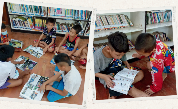
ตัวอย่าง

มูลนิธิเด็ก เล็งเห็นถึงความสำคัญของการส่งเสริมให้เด็กอ่านหนังสือ เพื่อเสริมสร้างปัญญาและสร้างสังคมแห่งการเรียนรู้