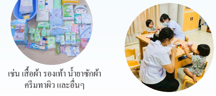
เช่น เสื้อผ้า รองเท้า น้ำยาซักผ้า ครีมหาผิว และอื่นๆ