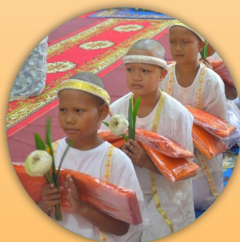
โรงเรียนพระปริยัติธรรมสามัญวัดสระเรียง ต.ในเมือง อ.เมือง จ.นครศรีธรรมราช ๙ - ๒๓ เมษายน ๒๕๖๗

ในปัจจุบัน เณรน้อยเหล่านี้นับว่ามีความสำคัญต่อสถาบันสงฆ์และสังคมไทยโดยรวม ด้วยมีหน้าที่เป็นผู้ช่วยรักษาและพัฒนาวัด (เกือบร้าง) ตามหมู่บ้านในชนบททั่วประเทศให้คืนกลับมามีชีวิตเป็นที่พึ่งทางจิตใจที่สำคัญของชุมชนอีกครั้ง