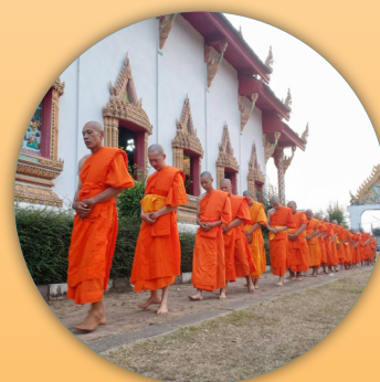
โรงเรียนพระปริยัติธรรมวัดนาราบ ต.น่าน้อย อ.น่าน้อย จ.น่าน ๓๑ มีนาคม - ๗ เมษายน ๒๕๖๗

ในปี พ.ศ. ๒๕๖๘ นับเป็นปีที่ ๓๔ ที่โครงการอาหารเพลและอาหารสมอเพื่อสามเณรในชนบท มูลนิธิเด็ก จะสนับสนุนวัดและโรงเรียนพระปริยัติธรรม จำนวน ๒๖ แห่ง ในการจัดกิจกรรมการบรรพชาสามเณร บวชศีลจารีณและบวชเยาวชนภาคฤดูร้อน ระหว่างวันที่ ๑ - ๓๐ เมษายน ๒๕๖๘ คาดว่าจะมีเด็กและเยาวชนเข้าร่วมกิจกรรม จำนวน ๑,๐๐๐ คน