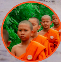
เด็กจกรม (หาดทุ่งโฮ๊ะ อ.สิชล) วัดสุขน ต.ทุ่งโฮ๊ะ อ.สิชล จ.นครศรีธรรมราช ๒ - ๒๐ เมษายน ๒๕๖๗