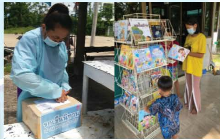
ศูนย์พักคอยผู้ป่วยติดเชื้อโควิด-19 นำหนังสือเป็นจุดรวมพลผู้ป่วยสีเขียว โรงพยาบาลส่งเสริมสุขภาพตำบลหนองยาง จังหวัดพะเยา

ค่อย ๆ เปิดกล่องเพื่อเข้าขบวนการฆ่าเชื้อก่อนเข้าพื้นที่ ๆ จัดเป็นสถานที่ศูนย์พักคอยสำหรับผู้ป่วยสีเขียว เพื่อเฝ้าดูอาการ ง่ายยารักษาตามอาการ นอกจากอาหาร ๓ มื้อ ก็ยังมีนิทาน ๓ มื้ออีกด้วย คนไหนที่อาการไม่หนักจะพากันมาเลือกหนังสืออ่านคั่นเวลา นอกจากนอนรอคุณหมอมาสอบถามอาการอย่างเดียว หนังสือเล่มเล็กสร้างรอยยิ้มที่สดใส