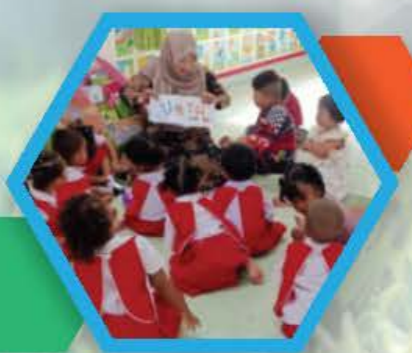
ศูนย์พัฒนาเด็กเล็กบ้านมายอ อำเภอฮารัต จังหวัดยะลา

เด็ก ๆ ได้ประโยชน์ คุณครูก็ดีใจมาก (ก.ล้านตัว) เด็กตื่นเต้นกับของขวัญชิ้นใหญ่ที่ได้รับจากผู้ใหญ่ใจดี ศูนย์พัฒนาเด็กในพื้นที่จังหวัดยะลา มีรณรงค์นิทานจำนวน ๑๑ คัด ๖ อำเภอ ๖ ตำบล (อำเภอเมืองยะลา เบตง บันนังสตา ฮารัต รามัน และกรงปินัง)