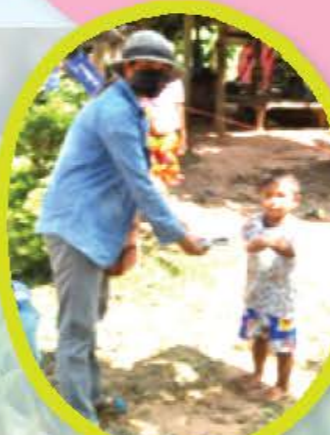
ส่งอาหารและยา พร้อมนิทานผู้ป่วยสีเขียวตามบ้าน โรงพยาบาลส่งเสริมสุขภาพตำบลทับทัน จังหวัดสุรินทร์

ค่อย ๆ เปิดกล่องเพื่อเข้าขบวนการฆ่าเชื้อก่อนเข้าพื้นที่ ๆ จัดเป็นสถานที่ศูนย์พักคอยสำหรับผู้ป่วยสีเขียว เพื่อเฝ้าดูอาการ ง่ายยารักษาตามอาการ นอกจากอาหาร ๓ มื้อ ก็ยังมีนิทาน ๓ มื้ออีกด้วย คนไหนที่อาการไม่หนักจะพากันมาเลือกหนังสืออ่านคั่นเวลา นอกจากนอนรอคุณหมอมาสอบถามอาการอย่างเดียว หนังสือเล่มเล็กสร้างรอยยิ้มที่สดใส