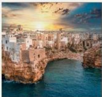
POLIGNANO A MARE

อิตาลีตอนใต้มีเสน่ห์ดึงดูดใจอย่างยิ่ง เป็นดินแดนโรมันติกแห่งปราสาท โบสถ์ และซากปรักหักพังแบบคลาสสิก ไม่ว่าจะเป็นวิลล่าโพสิทาโน อามาเร่ ร้านอาหารสุดหรูในถ้ำ GROTTA PALAZZESE พระราชวังในโพซิทาโน อ่าวเนเปิลส์มีเสน่ห์ดึงดูดใจอย่างเหลือเชื่อ ตั้งแต่เกาะคาปรีที่สวยงามตระการตาไปจนถึงภูเขาไฟที่สงบนิ่ง และแหล่งโบราณคดีระดับโลกไปจนถึงชายฝั่งอามาลฟีที่คดเคี้ยว แคว้น “ปูลยา” เป็นที่รู้จักกันดี ด้วยสถาปัตยกรรมแบบโรมานเนสก์และบาโรก ปราสาทของนักรบครูเสด และบ้านทรงกรวยคล้ายรังผึ้งที่เรียกว่าทูลลี เป็นจุดหมายปลายทางที่กำลังมาแรง