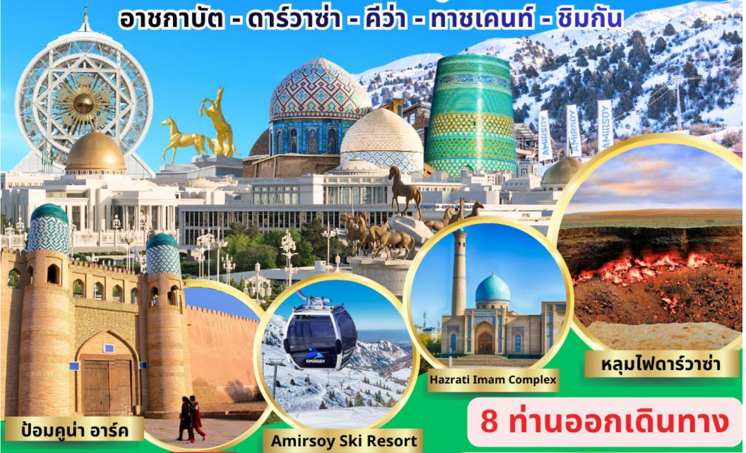
ป้อมคูน่า อาร์ค

อาชกาบัต - ดาร์วาซ่า - คีว่า - ทาชเคนท์ - ซิมกัน