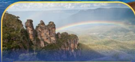
อุทยานแห่งชาติลูน่าปาร์ก Three Sister Rock