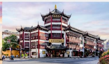
ตลาดร้อยปีเงินหวงเมี่ยว