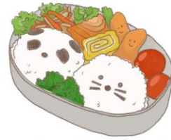
● อาหารสำหรับเด็ก ( 2-11 ปี ) *วัตถุดิบขึ้นอยู่กับทาว์ราน