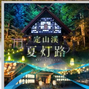
“JOZANKEI NATSU TOURO 2026”