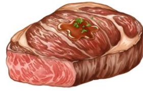
● เนื้อหมู