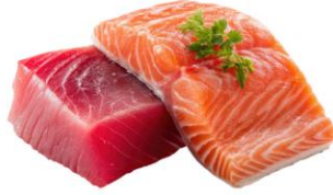
● เนื้อปลาดิบ