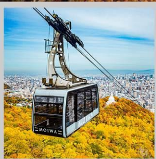
“MT. MOIWA ROPEWAY”