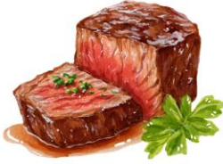
● เนื้อวัว

30 ความกรุณาเรื่องวัตถุดิบที่ท่าน แพ้หรือไม่สามารถรับประทานได้