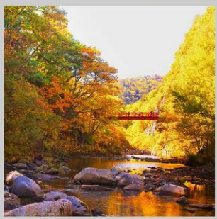
“JOZANKEI FUTAMI BRIDGE”