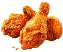
● เนื้อสัตว์ปีก (ไก่)