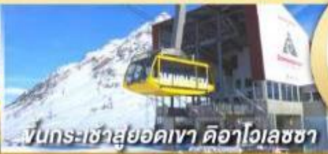
ขึ้นกระเช้าสู่ยอดเขา ดืออาไวลชซา