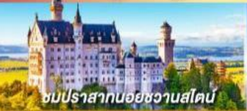
ชมปราสาทออยชวานสไตน์