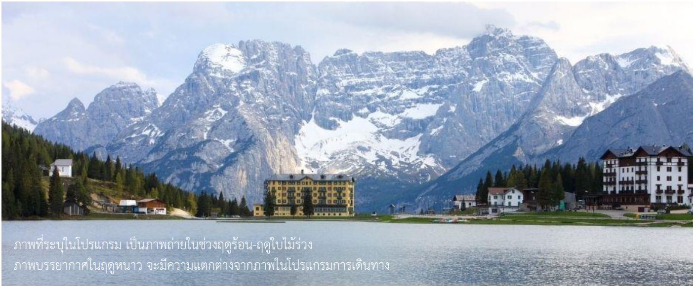
ภาพที่ระบุในโปรแกรม เป็นภาพถ่ายในช่วงฤดูร้อน-ฤดูใบไม้ร่วง ภาพบรรยากาศในฤดูหนาว จะมีความแตกต่างจากภาพในโปรแกรมการเดินทาง