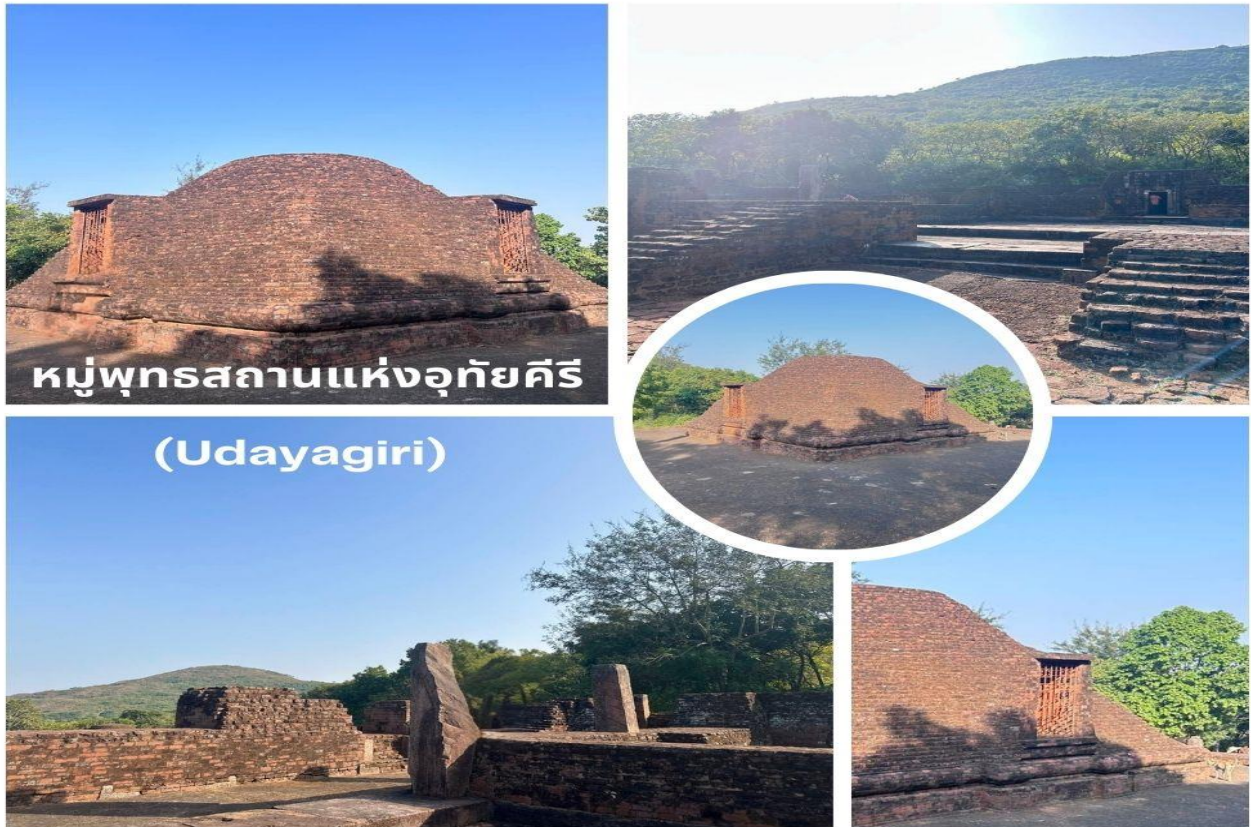
หมู่พุทธสถานแห่งอุทัยคีรี