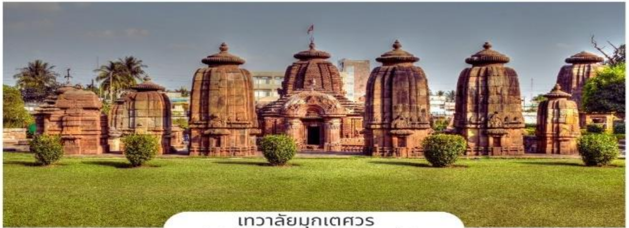
เทวาลัยมุกเตศวร (Mukteshvara Temple)