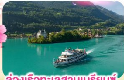
ล่องเรือทะเลสาบเบรียนซ์

พิชิตยอดเขาชูเนกกา 1 ในเขาที่สวยงามที่สุดเมืองเซอร์แมท