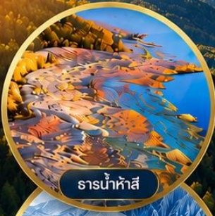
ธารน้ำห่าสี