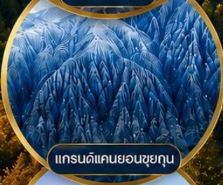
แกรนด์แคนยอนชุยถุน