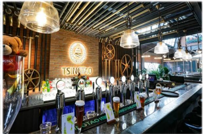
คำ รับประทานอาหารค่ำ ณ ภัตตาคาร