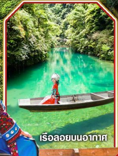
เรือลอยบนอากาศ