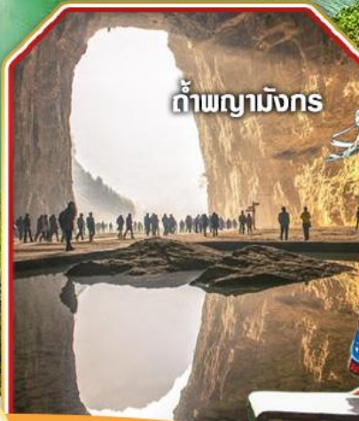
ถ้ำผิงมิงก