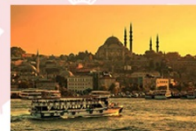
ล่องเรือช่องแคบบอสฟอรัส