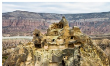
นครใต้ดิน