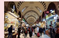
ตลาดสไปซ์มาร์เกต

** พักที่ TAKSIM GONEN HOTEL 4* หรือเทียบเท่า **