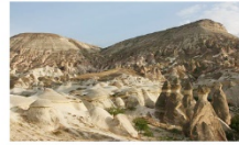
หุบเขาเคเฟเรนท์