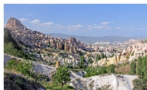
หมู่บ้านของนกพิราบ

** พักที่ DEDELI CAVE HOTEL 5* หรือเทียบเท่า **