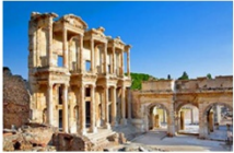
เมืองโบราณเอเฟซุส