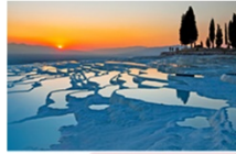
ปามุคคาเล่

** พักที่ RICHMOND THERMAL HOTEL 5* หรือเทียบเท่า **