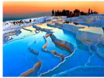
เมืองปามุกคาเล่

** พักที่ Richmond Thermal Hotel 5* หรือเทียบเท่า **