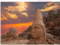
ชมพระอาทิตย์ตกดิน ณ ภูเขาเนมรุต

** พักที่ Euphrat Hotel Nemrut 4* หรือเทียบเท่า **