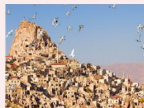
หมู่บ้านของนกพิราบ

** พักที่ Under Cave Hotel 5* หรือเทียบเท่า **