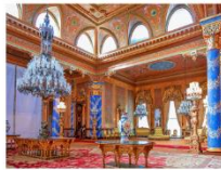
Beylerbeyi Palace ล่องเรือช่องแคบบอสฟอรัส