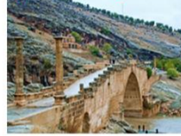
สะพานเซเวอรัน