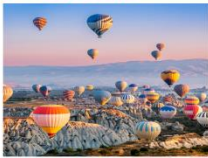
เมืองคัปปาโดเกีย

** พักที่ Under Cave Hotel 5* หรือเทียบเท่า **